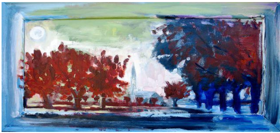
Lo conficherò come un piolo in luogo solido (2017)