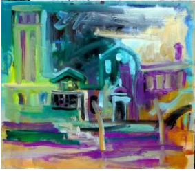
Aprimi gli occhi perché io consideri le meraviglie della tua legge (2017)