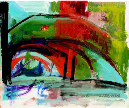
Still got such a long way to go (2017)

Peggiori questi personaggi oppure quegli che ostentano in pubblico una religiosità alla quale si fa fatica a credere, tipo Donald Trump e la sua cosiddetta Camminata di Gerico del 2 giugno dello scorso anno mentre brandiva una Bibbia o, su questa sponda dell'Atlantico, il Primo Ministro britannico che dopo anni di libertinaggio ha sposato con rito cattolico l'ultima delle sue compagne di vita, oppure Matteo Salvini, sempre pronto a sfoderare un rosario davanti ai telecronisti?